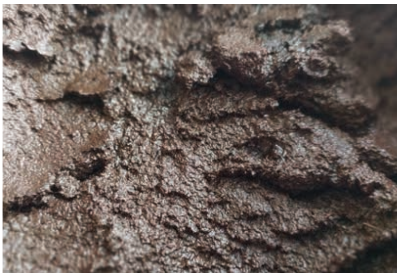
Rašelina používaná v balneo provozech.

Výsledkem řešení studie bude zcela nový způsob úpravy rašeliny pro aplikace v balneologii a ve wellness procedurách v lázeňských zařízeních, který může pro provozovatele lázeňské péče zjednodušit a zefektivnit postupy využívající přírodní humolity, případně i peloidy, a současně s tím i zatraktivnit lázeňskou péči pro pacienty spojenou s aplikací rašeliny.